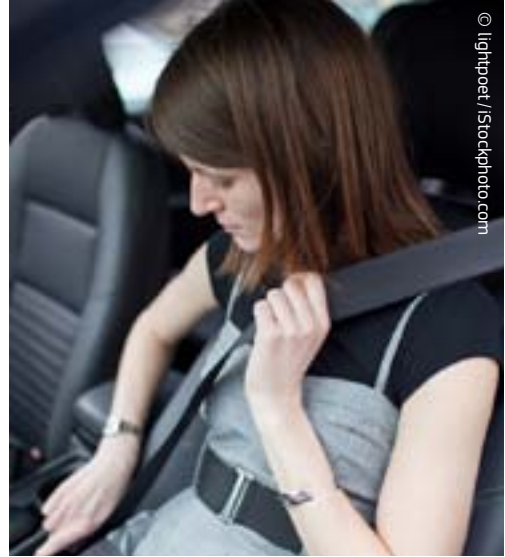
Ο αριθμός των θανατηφόρων τροχαίων ατυχημάτων στην ΕΕ μειώθηκε κατά 43 % σε σχέση με το 2001.

Προτού ένα παιχνίδι τεθεί σε κυκλοφορία στην αγορά της ΕΕ, έχει υποστεί αυστηρούς ελέγχους ως προς την κατασκευή και τα μικρά εξαρτήματά του, την ευφλεκτότητα, τις χημικές ιδιότητες, τις ηλεκτρικές ιδιότητες, την υγιεινή και τη ραδιενέργεια.