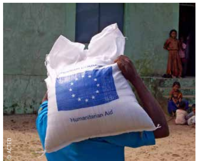
Η ΕΕ χρηματοδοτεί την παροχή ανθρωπιστικής βοήθειας στην Ινδία από το 1996.

Για να βοηθήσει τις χώρες να αποφεύγουν τις καταστροφές και να είναι προετοιμασμένες για περιπτώσεις έκτακτης ανάγκης, καθώς και για να συγκεντρώσει τους πόρους που θα μπορούν να διατίθενται σε χώρες που πλήττονται από καταστροφές, η ΕΕ έχει θεσπίσει έναν Μηχανισμό Πολιτικής Προστασίας. Παρόλο που η ανθρωπιστική βοήθεια της ΕΕ παρέχεται σε χώρες που δεν είναι κράτη μέλη της, ο μηχανισμός αυτός μπορεί να ενεργοποιηθεί σε περιπτώσεις έκτακτης ανάγκης τόσο εκτός όσο και εντός ΕΕ. Ο Μηχανισμός Πολιτικής Προστασίας προωθεί τη συνεργασία των κρατών μελών της ΕΕ στον τομέα της πολιτικής προστασίας. Στηρίζει τις προσπάθειες των κρατών μελών σε εθνικό, περιφερειακό και τοπικό επίπεδο, παρέχοντας αποτελεσματικά «εργαλεία» για την πρόληψη, την ετοιμότητα και την αντιμετώπιση φυσικών ή ανθρωπογενών καταστροφών.