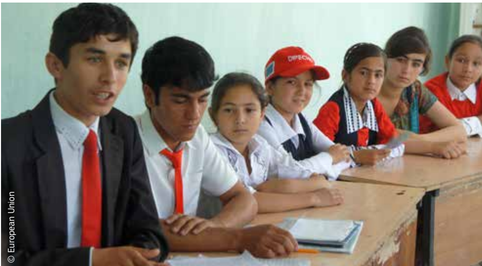
Εθελοντές εκπαιδεύονται στο Τατζικιστάν ως μέλη των ομάδων αντιμετώπισης έκτακτων καταστάσεων, στο πλαίσιο του προγράμματος Dipecho.

Άλλες ασκήσεις προσομοίωσης αφορούσαν την εκδήλωση δασοπυρκαγιάς από σπινθήρες των φρένων ενός τρένου ή μια πλημμύρα σε χωριό λόγω κατάρρευσης δεξαμενής. Ασκήσεις τέτοιου τύπου διοργανώνονται κάθε χρόνο με χρηματοδοτική συνεισφορά της ΕΕ.