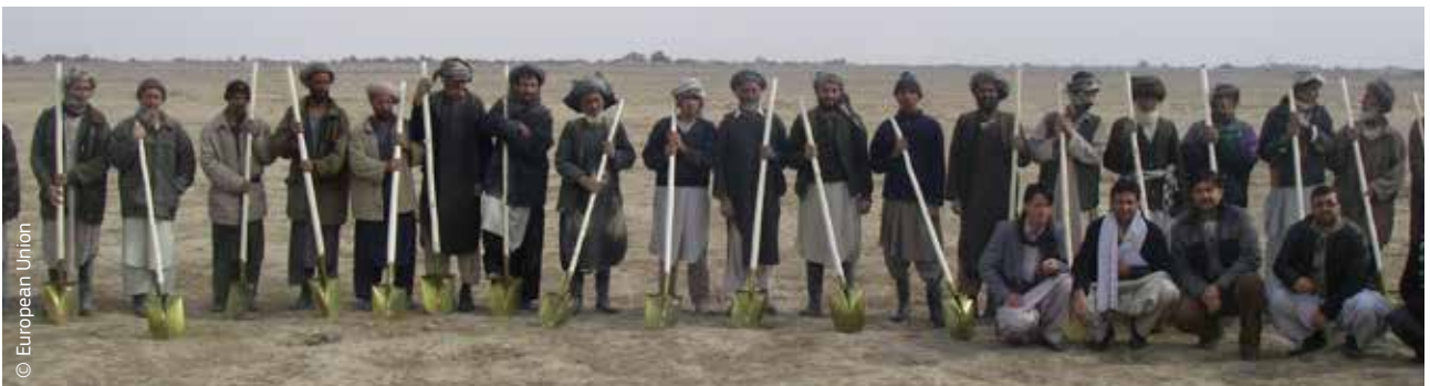
Αφγανοί παραλαμβάνουν εργαλεία στο πλαίσιο χρηματοδοτούμενης από την ECHO βοήθειας για την αντιμετώπιση ξηρασίας που προκάλεσε λιμό και εκτόπιση ντόπιων πληθυσμών.

Το 2007 τα θεσμικά όργανα της ΕΕ και τα 27 κράτη μέλη της συμφώνησαν σε ένα βασικό έγγραφο πολιτικής με τον τίτλο «Ευρωπαϊκή Κοινή Αντίληψη για την Ανθρωπιστική Βοήθεια». Το έγγραφο αυτό υπογραμμίζει ότι η ανθρωπιστική βοήθεια που παρέχει η ΕΕ δεν αποτελεί πολιτικό εργαλείο και επαναβεβαίωσε τις βασικές αρχές που τη διέπουν: ουδετερότητα, ανθρωπισμός, ανεξαρτησία και αμεροληψία. Ορίζει επίσης με σαφήνεια τον ρόλο των διαφόρων παραγόντων ανθρωπιστικής δράσης στις ζώνες κρίσεων, έτσι ώστε να ενισχυθεί η ικανότητα της ΕΕ να παρέχει βοήθεια.