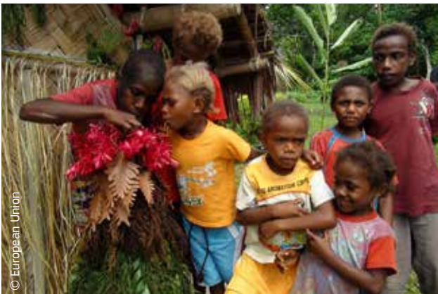
Στο Βανουάτου, τα παιδιά βοηθούν στην κατασκευή μοντέλου της μεγαλύτερης απειλής για τη ζωή τους, του ηφαιστείου του Όρους Γκαράτ.

Εστιάζοντας την προσοχή της στη θωράκιση των ντόπιων πληθυσμών έναντι των καταστροφών, η Ευρωπαϊκή Επιτροπή επιδιώκει να σώσει ζωές, να εξασφαλίσει μια καλύτερη σχέση κόστους-αποδοτικότητας και να συμβάλει στη μείωση της φτώχειας, έτσι ώστε η παρεχόμενη βοήθεια να φέρει πολλαπλά οφέλη και να προωθήσει τη βιώσιμη ανάπτυξη.