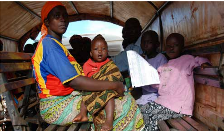
Εκποτισμένη οικογένεια από το Μπουρούντι μπόρεσε να επιστρέψει στο σπίτι της χάρη στη βοήθεια επανεγκατάστασης που χορήγησε η ΕΕ.

Για την καλύτερη διαχείριση του μακροπρόθεσμου αντικτύπου των καταστροφών και τη βελτίωση των μέτρων πρόληψης και ετοιμότητας, η παροχή ανθρωπιστικής βοήθειας και η αντιμετώπιση κρίσεων πρέπει να συνδυάζονται με ενέργειες σε τομείς όπως η αναπτυξιακή συνεργασία και η προστασία του περιβάλλοντος. Γι' αυτό απαιτείται συντονισμός σε επίπεδο ΕΕ.