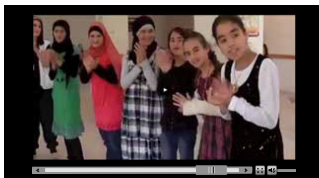
Η εκπαίδευση βοηθά όσα παιδιά έπασαν θύματα συγκρούσεων να παραμείνουν παιδιά.

Έχοντας αυτό κατά νου, η Ευρωπαϊκή Επιτροπή κάλεσε τις ανθρωπιστικές οργανώσεις και οργανισμούς που είναι εταίροι της να προτείνουν κατάλληλα σχέδια για χρηματοδότηση. Ως αποτέλεσμα, τα χρήματα του βραβείου Νομπέλ θα διατεθούν σε τέσσερα σχέδια στο πλαίσιο της πρωτοβουλίας της ΕΕ «Παιδιά της Ειρήνης». Στο σύνολό τους, τα σχέδια αυτά θα ωφελήσουν περισσότερα από 23 000 παιδιά στο Ιράκ, την Κολομβία, τον Ισημερινό, την Αιθιοπία, τη Λαϊκή Δημοκρατία του Κονγκό και το Πακιστάν, δίνοντάς τους πρόσβαση σε βασική εκπαίδευση και σε χώρους φιλικούς προς τα παιδιά, παρέχοντάς τους προστασία, παιδεία και μια ευκαιρία για καλύτερο μέλλον.