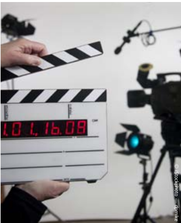
Επιχείρηση ΚΙΝΟ: φέρνοντας τον κινηματογράφο σε απομακρυσμένες περιοχές της ΕΕ

Οι επαγγελματίες συνέστησαν επίσης κριτική επιτροπή η οποία επέλεξε σχέδια των παιδιών. Από 233 σχέδια επελέγησαν 66 για να εκτεθούν. Τα 22 από αυτά προωθήθηκαν στη συνέχεια για να μετατραπούν σε πρωτότυπα μοντέλα με τη βοήθεια επαγγελματιών. Περισσότερα από 76 000 άτομα το 2009 επισκέφθηκαν την έκθεση, η οποία ταξίδεψε στο Ελσίνκι, τη Γάνδη και τη Γλασκόβη.