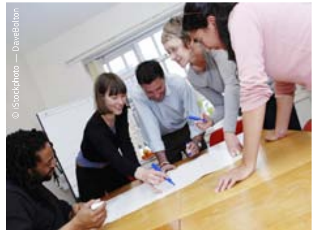
Η ευρωπαϊκή πολυμορφία είναι ένα κράμα δημιουργίας.

Η ενιαία αγορά οπτικοακουστικών μέσων και η κατάρτιση προγράμματος για ασφαλέστερη χρήση του διαδικτύου, ώστε να προστατεύονται καλύτερα τα παιδιά που χρησιμοποιούν το διαδίκτυο σε όλη την ΕΕ, είναι μόνο δύο από τα θέματα για τα οποία η ευρωπαϊκή προσέγγιση μπορεί να είναι αποτελεσματικότερη από τη δράση σε εθνικό επίπεδο. Τα προγράμματα MEDIA και MEDIA Mundus συμπληρώνουν τις εθνικές χρηματοδοτήσεις για στήριξη του ευρωπαϊκού κινηματογράφου, αυξάνουν την κυκλοφορία νέων ταινιών και βελτιώνουν την ανταγωνιστικότητα του οπτικοακουστικού τομέα.