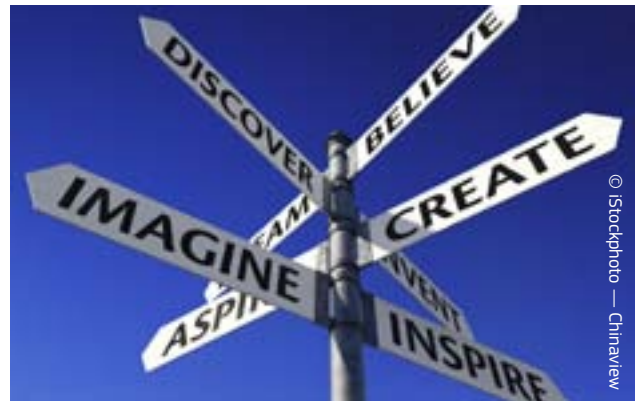
Οι καλύτερες ιδέες προέρχονται από κάθε γωνιά της ΕΕ.

Συμμετοχή του ευρύτερου κοινού στο πολιτιστικό όραμα της ΕΕ: για να προκύψουν οικονομικά οφέλη από την πολιτιστική μας πολυμορφία και να υπάρξει σεβασμός και κατανόηση μεταξύ των πολιτισμών, οι πολιτικές σε όλα τα επίπεδα πρέπει να περιλαμβάνουν μέτρα για την ένταξη του πολιτισμού στην εκπαίδευση, την τόνωση της παραγωγής πολιτιστικών αγαθών και την ευρύτερη συμμετοχή του κοινού.