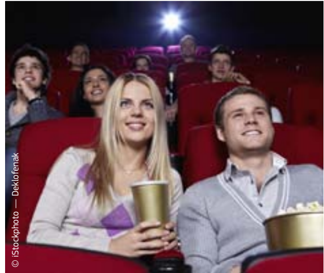
Το δίκτυο ευρωπαϊκών κινηματογράφων «Eurora Cinemas» ενισχύει το προφίλ του ευρωπαϊκού κινηματογράφου.